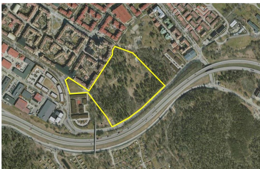
Ortofoto med området för jämförelseförfarandet markerat.

Tomten som jämförelseförfarandet gäller omfattar södra delen av Skärgårdsskogen i östra Skarpnäck. Området är kuperat och bebyggelsen placeras till största delen i den flackare delen av skogen mellan två höjdparter. Topografin kommer att ha stor påverkan på bebyggelseutformningen där vissa kvarter innehåller en höjdskillnad på upp till sju meter.