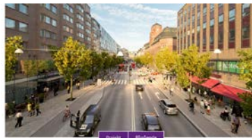
Vasagatan rustas upp Hösten 2020

Vi bygger om Vasagatan för att möta dagens och framtidens behov. Med bredare trottoarer, nya cykelbanor, fler träd, fler sittplatser och ny