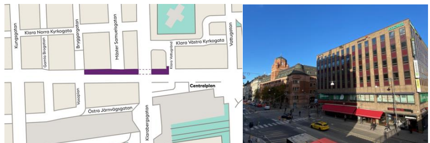
Karta över nya området som berörs. Höger: Sträckan Bryggarg-Klarabergsg

restauranger och andra verksamheter i gatuplan och utskick av tidplaner för hur arbetet bedöms påverka har skett inför starten. Arbetena i de nya områdena beräknas pågå till och med december 2021. Mellan januari- februari 2022 blir det vinterpaus i arbetena. I mitten av mars 2022 fortsätter och färdigställs sträckorna till slutet av maj 2022.