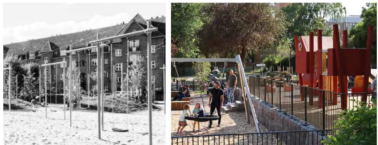
KOLONIHUSEN, KLÄTTERLEKEN OCH GUNGBERSÅN - De befintliga terrasseringarna fylls med lek i olika teman. Kolonihusen innehållande små trähus för rollek, klätterleken med lite mer utmanande klätter-möjligheter och gungbersån med gungor och volträcken. Sandleken innehåller bakkbord och djurskulpturer