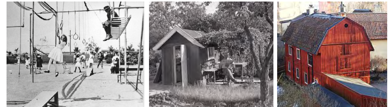
STILFÖREBILDER - LEKUTRUSTNING FRÅN 40-TALET, KOLONIOMRÅDETS STUGOR OCH FAGGENS KROGS FALURÖDA FÄRG

Mark- och grönytor runt plaskdammen... kommer att förbättras för att minska risk för jordbakterier i vattnet.