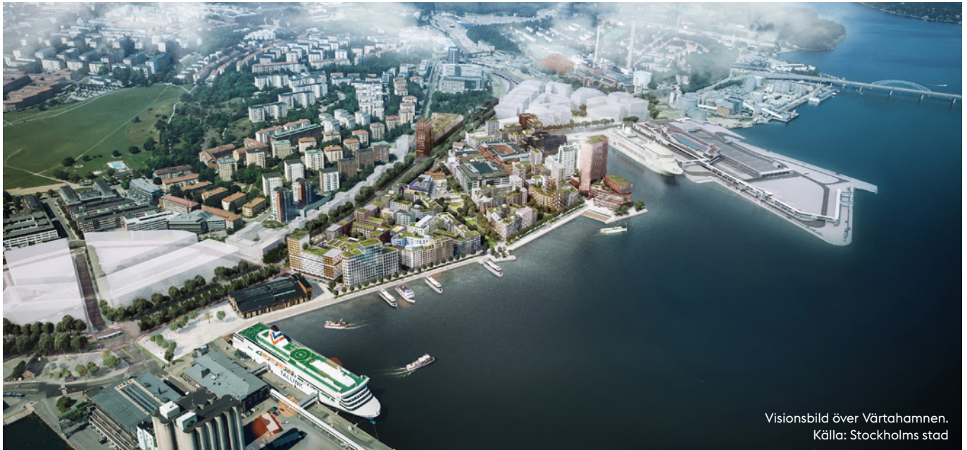
Visionsbild över Värtahamnen.