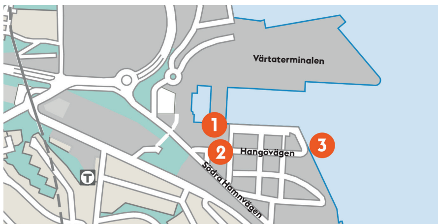
1. Ny passagerargång 2. Kvarteret Hangö 3. Saltkajen