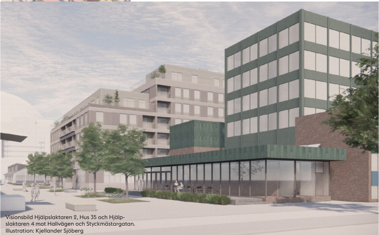
Visionsbild Hjälpslaktaren 2, Hus 35 och Hjälpslaktaren 4 mot Hallvägen och Styckmästargatan. Illustration: Kjellander Sjöberg