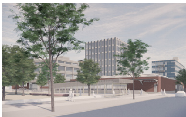
Visionsbild över Centrala parken längs Hallvägen söderut. Illustration: Kjellander Sjöberg.

Visionsbild över Centrala parkens nedsänkta gräsrunnel. Nedsänknigen skapar ett naturligt rum samtidigt som den kan hantera stora volymer vatten vid skyfall. Illustration: Kjellander Sjöberg