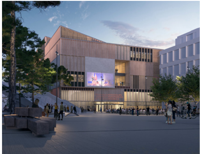
Visionsbild på Stockholms konstnärliga högskola (SKH). Illustration: 3XN

Stockholms konstnärliga högskola (SKH) samlar sina idag utspridda verksamheter och bygger en ny skola i Slakthusområdet. SKH bedriver utbildning och forskning inom cirkus, dans, film och media, opera och teater. Skolan har cirka 450 helårsstudenter och omkring 200 personer anställda.