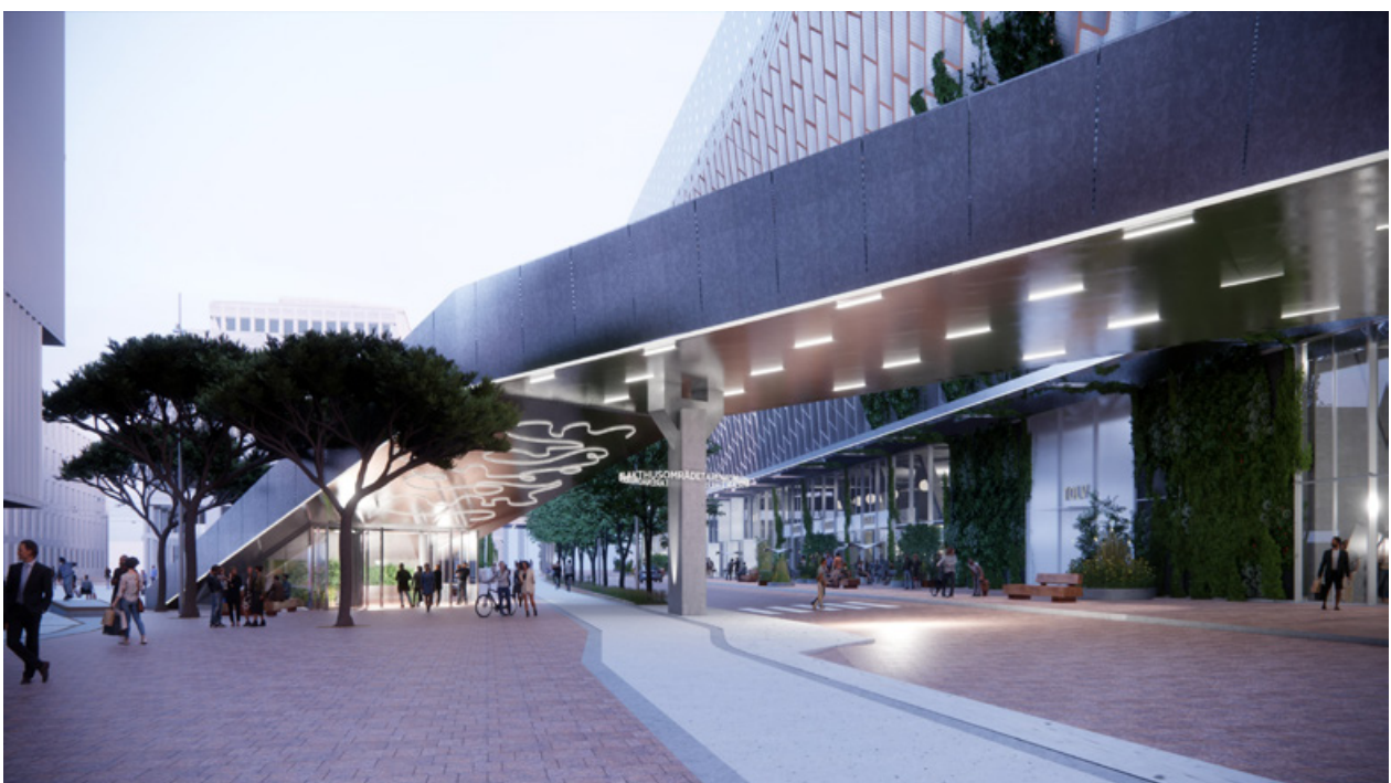
Visionsbild 4C som kvällsbild över Södra trappan vid Evenemangstorget. Illustration: C.F. Möller