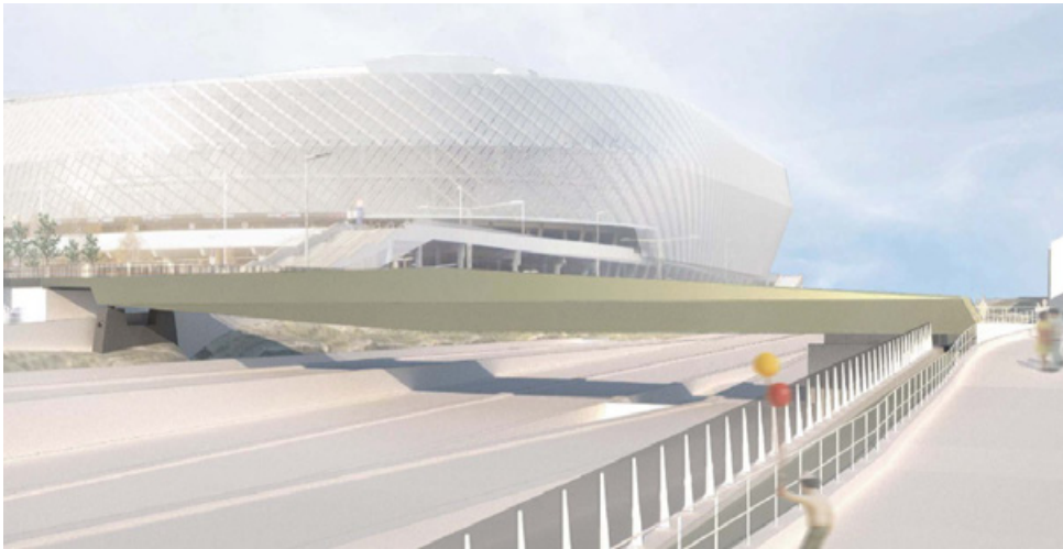
Visionsbild 4C med ny gång- och cykelbro över Nynäsvägen. Illustration: Rundquist Arkitekter