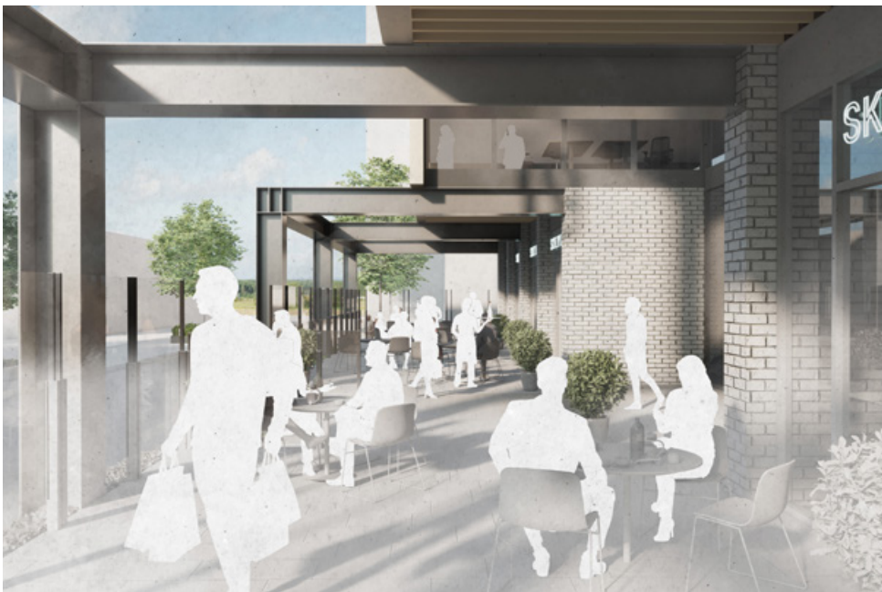
Visionsbild 4C med lastkaj på ny kontorsbyggnad. Illustration: Gatun Arkitekter