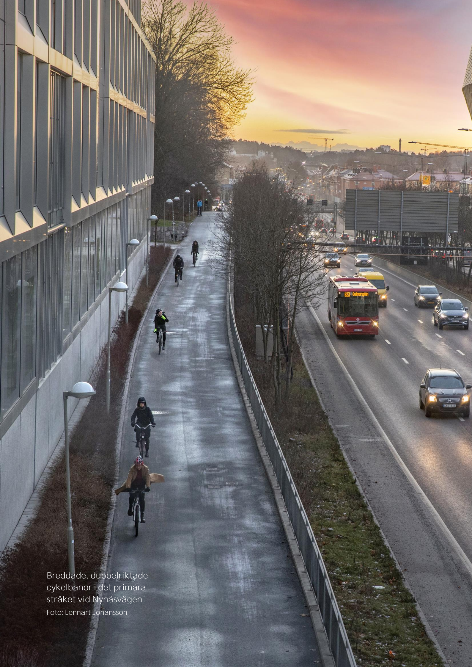
Breddade, dubbelriktade cykelbanor i det primära stråket vid Nynäsvägen