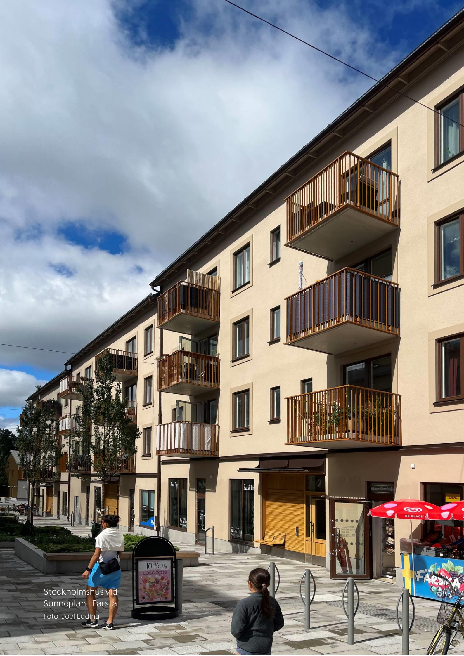
Stockholmshus vid Sanneplan i Farsta