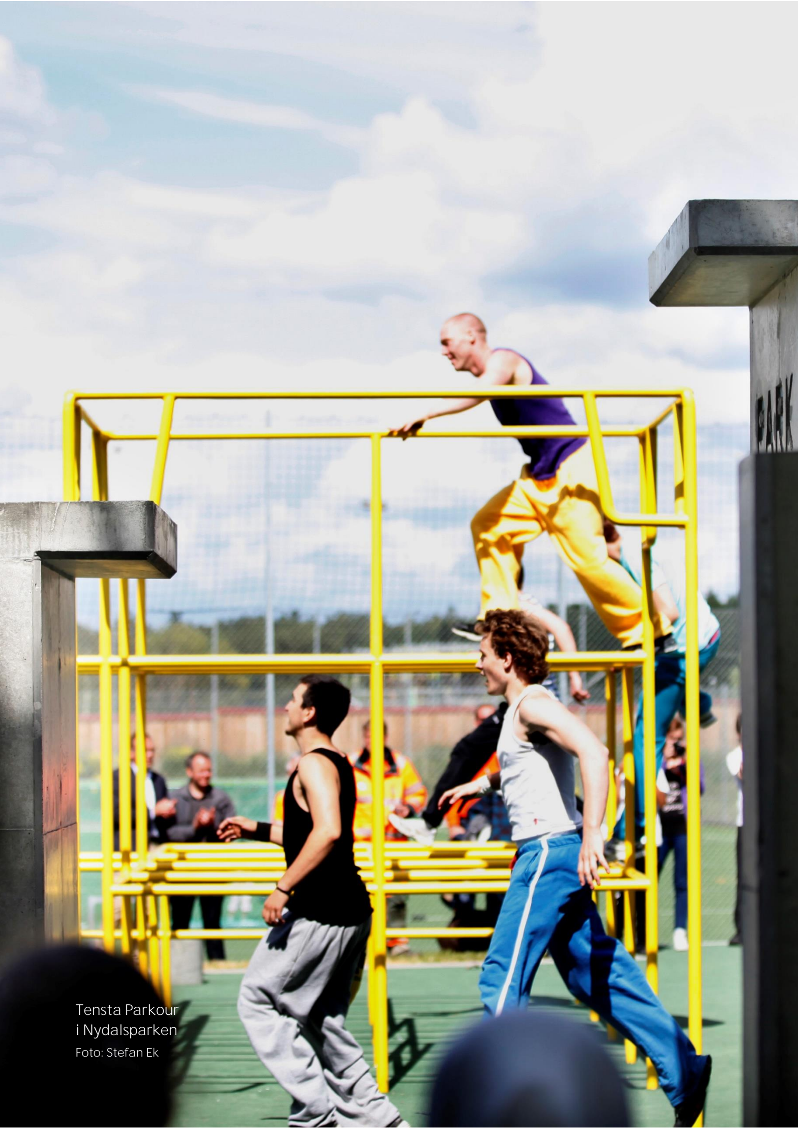
Tensta Parkour i Nydalsparken