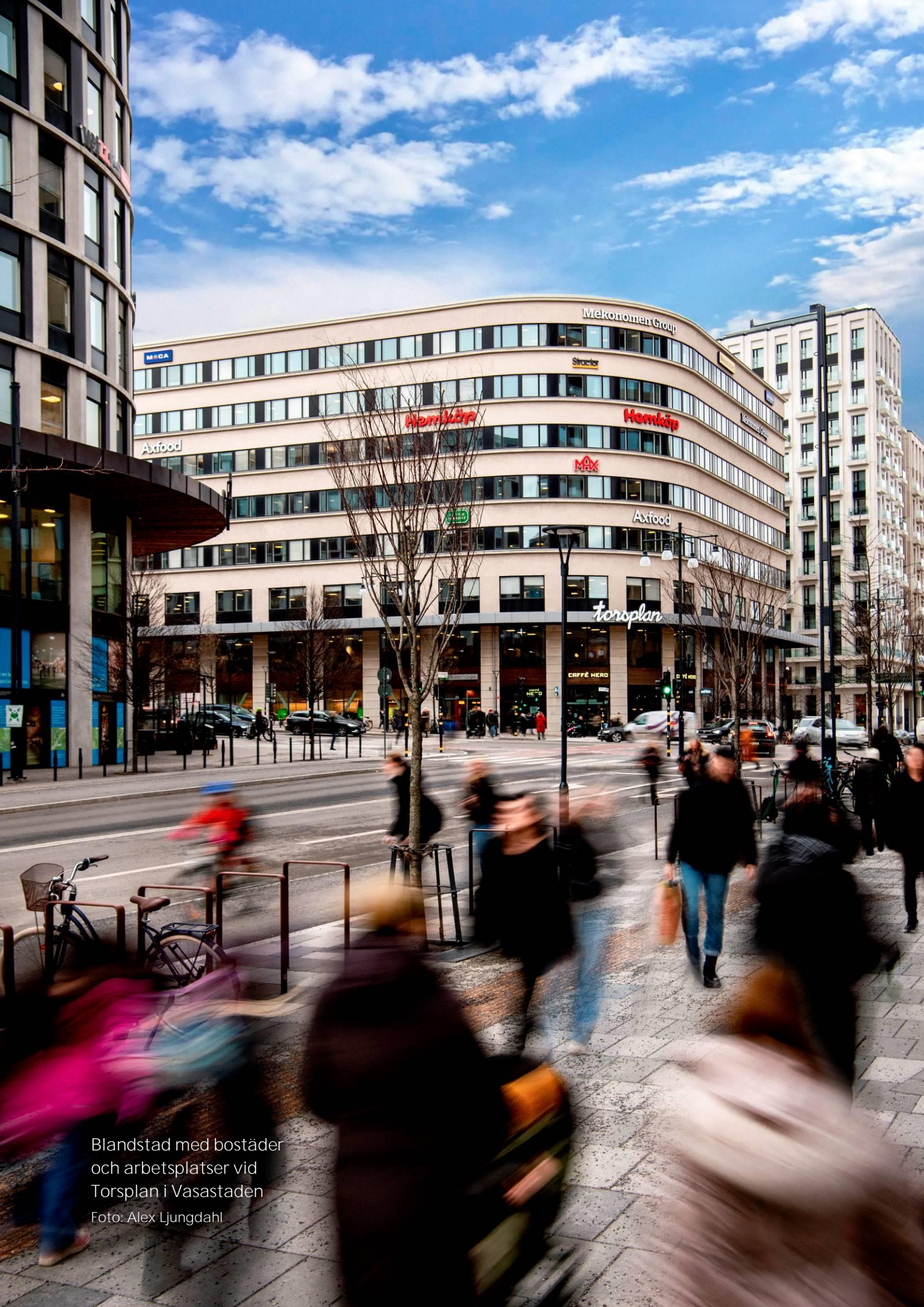
Blandstad med bostäder och arbetsplatser vid Torsplan i Vasastaden