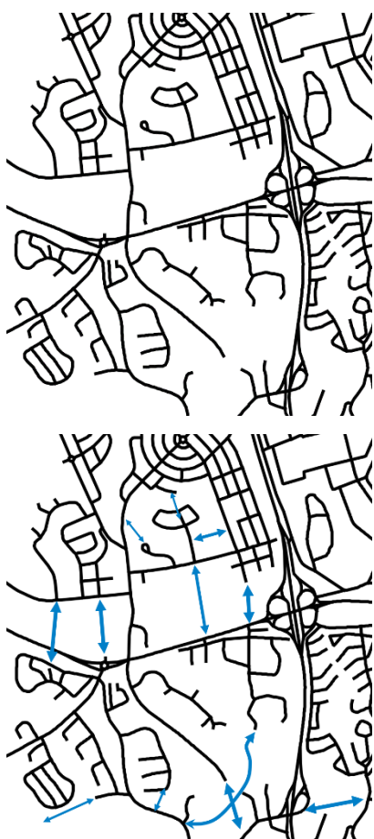
Figur 2. Principskiss över isolerade gatustrukturer och potentialen i att koppla samman med flera länkar.

Sammanställningen visar på en mångfald av tillgängliga verktyg för att stärka sambanden. De olika verktygen används i samtliga tolv strategiska samband, dock i varierande omfattning och med olika stor effekt. På en strukturell nivå föreslås stadsdelar knytas tätare varandra genom ny bebyggelse och stadsrum som stärker stråk och förändrar rörelsemönster. Samtidigt ska stadsdelarnas egenarter och karaktär värnas, samt hänsyn tas till översiktsplanens mål om stärkta ekologiska samband. Nya målpunkter ger skäl för stockholmarna att röra sig över stadsdelsgränserna. Exempel är skolor, förskolor, kulturinstitutioner samt park- och idrottsfunktioner som planeras och byggs inom de strategiska sambanden. Genom att komplettera ett ensidigt bostadsutbud med underrepresenterade upplåtelseformer och nya bostadstyper möjliggörs både en boendekarriär inom stadsdelen och för nya grupper att flytta in. Detta har en potential att på sikt minska skillnaderna i livsvillkor mellan stadens delar.